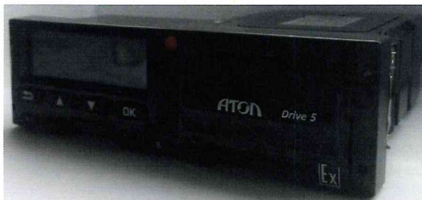
Рисунок 1 – Общий вид тахографа

Схема пломбировки от несанкционированного доступа с указанием места нанесения знака утверждения типа приведена на рисунке 2.